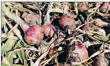
Présenté en grappe, qui est son mode de conservation traditionnel, l'oignon rosé de Roscoff garde sa saveur de long mois.